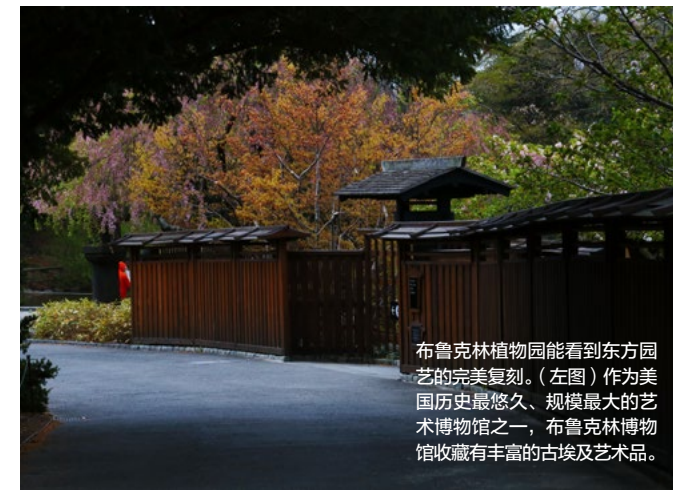
布鲁克林植物园能看到东方园艺的完美复刻。（左图）作为美国历史最悠久、规模最大的艺术博物馆之一，布鲁克林博物馆收藏有丰富的古埃及艺术品。