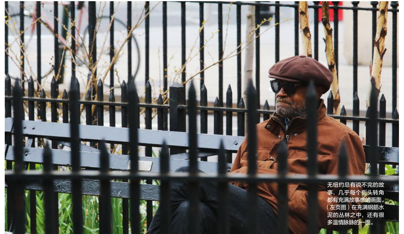
无纽约总有说不完的故事,几乎每个街头转角都有充满故事感的画面。(左页图)在充满钢筋水泥的丛林之中,还有很多温情脉脉的一面。

纽约康莱德酒店(Conrad New York ●)新天新地的下城区早已成为纽约客的新宠,2015年在河边开幕的康莱德就是这一区的精神核心。以更适合当代生活习惯而设计的标准套房在曼哈顿岛上略显奢侈:即便是最基本的房间,也包含了一室一厅、一厨一卫的“公寓式”格局,即使是迷你厨房,独立的水槽和简单的厨具都会带来家居生活的暖意,独立宽敞的客厅空间将动静分区做得恰到好处,整洁的先进景观卧室带来更安心的睡眠。主打意大利菜的餐厅彻底摆脱掉了五星级酒店